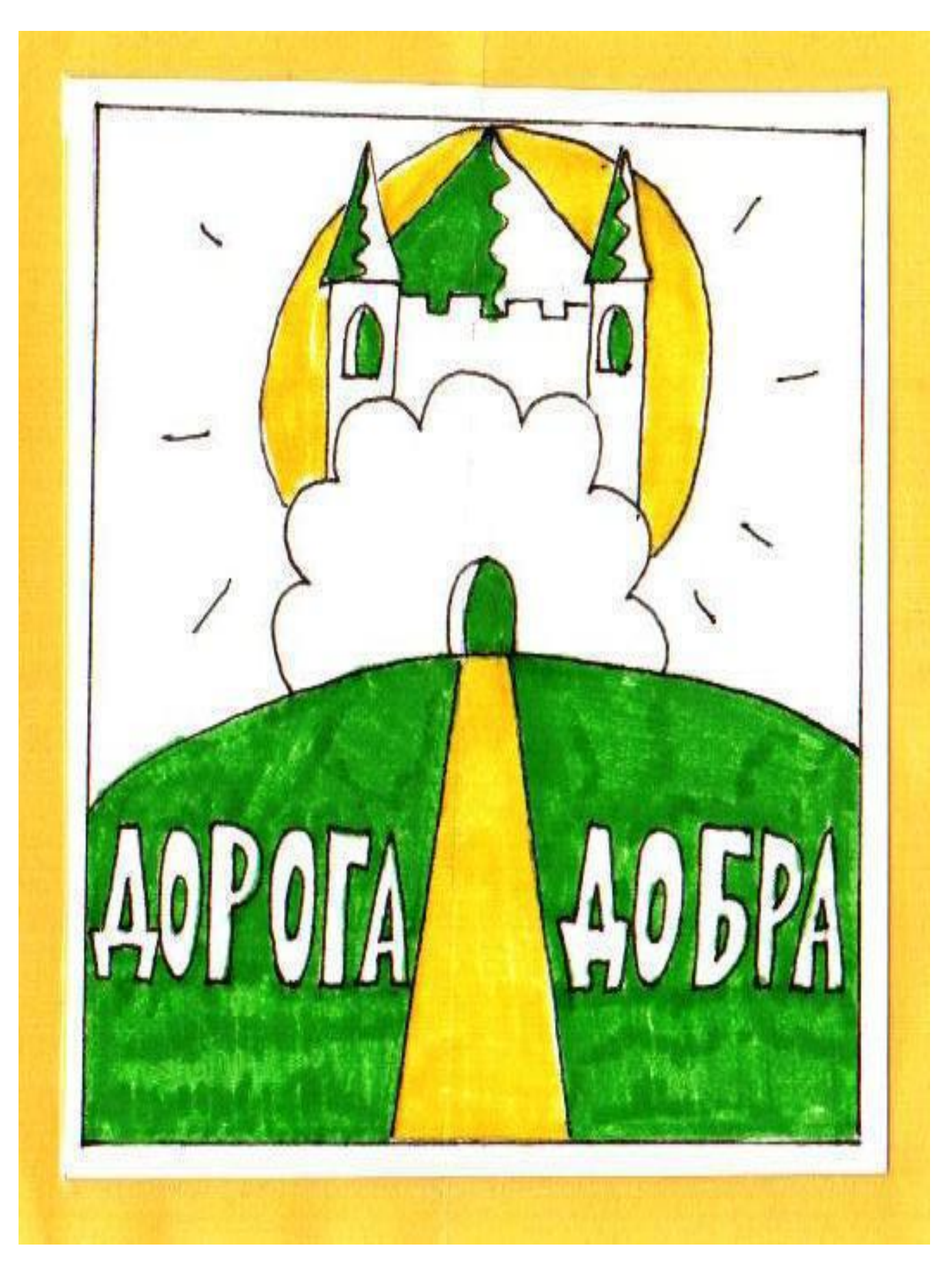
Цикл мероприятий для детей старшего дошкольного возраста