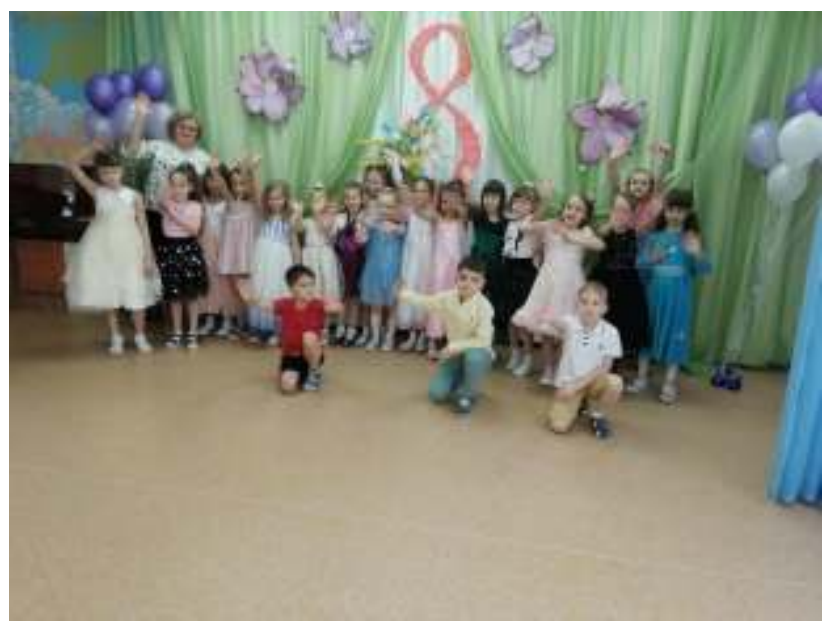
«Здравствуй, Масленица!» (музыкально – игровой досуг)